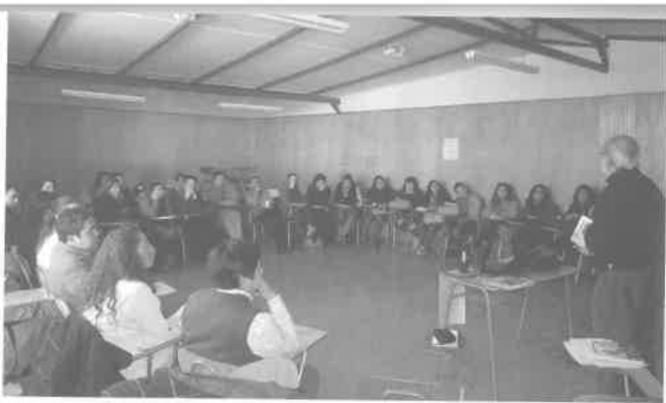
Educadors de l'Institut Técnico del Valle Central La Serena.

educadors, estudiants, associacions de professionals de la salut, veïns d'una comunitat camperola i/o veïnal d'un barri, etcètera. La majoria varen ser actes molt oberts, on tothom podia dir-hi la seva, però amb un dinamitzador per introduir els temes i establir un ordre. El taller o presentació sempre era una excusa per fer una denúncia local o parlar dels conflictes que amoïnaven el col·lectiu a qui s'adreçava. L'activitat servia per contextualitzar el conflicte o la lluita del grup en una lluita més global. Sense mencionar-lo, seguïem el vell lema ecologista d'«actua localment i pensa globalment».