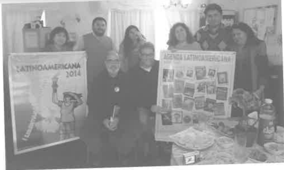
Educadors entitat SERPAJ Iquique.