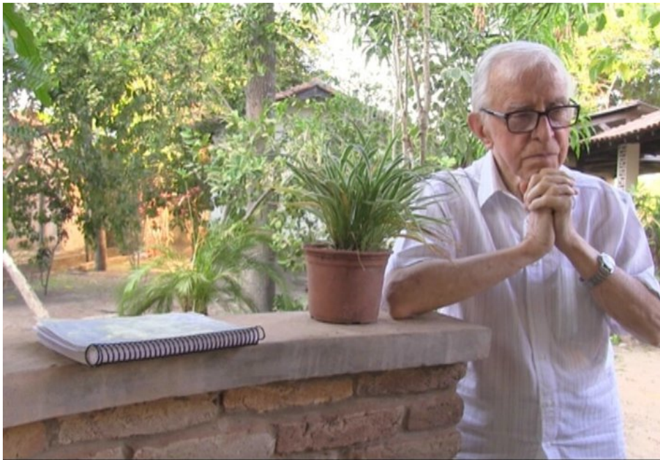
El bisbe Pere Casaldàliga, en un reportatge de TV3 i en una entrevista del 2012.