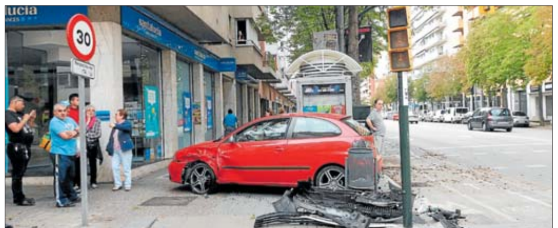
Un dels cotxes va quedar sobre la vorera després de l'accident. LAURA FANALS

mell va xocar amb un altre i va pujar sobre de la vorera. Pel que sembla, un dels dos conductors va quedar ferit i va haver de ser atès pel Sistema d'Emergències Mèdiques (SEM). Segons els diversos testimonis, el conductor que va saltar-se el semàfor va quedar poc ferit i va poder sortir pel seu propi peu. A més, aquest conductor hauria marxat del lloc de l'accident.